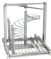
Стелаж для анестезійного приладдя