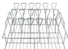
Стелаж для ємностей/ Стелаж для взуття