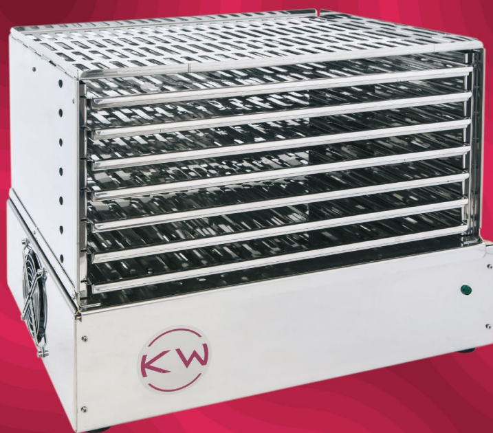
ПЕРЕМІШУВАЧ ТРОМБОЦИТІВ KWAP48